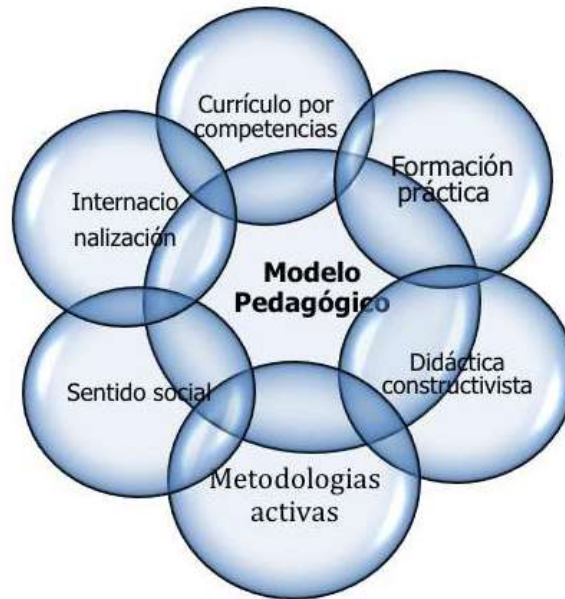
Figura 1. Modelo Universitario.